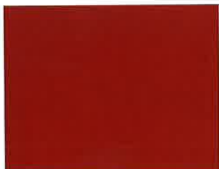
赤さび色 (日塗工 09-40L近似)