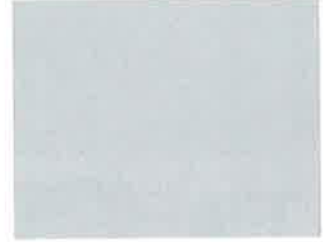
ライトグレー (日塗工 N-75近似)