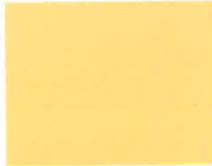
オーカー (日塗工 19-85L近似)